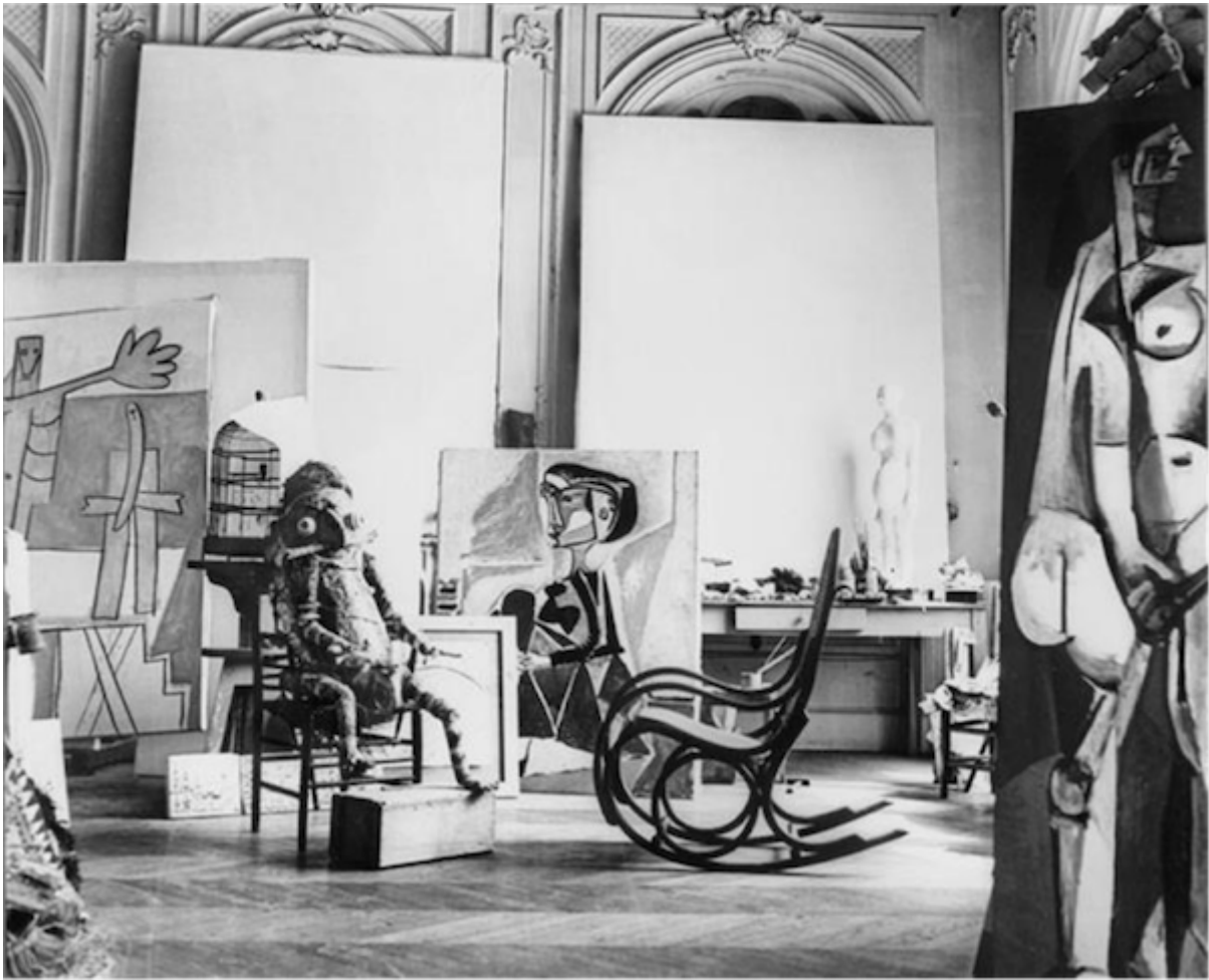
Tirage non daté [1957].