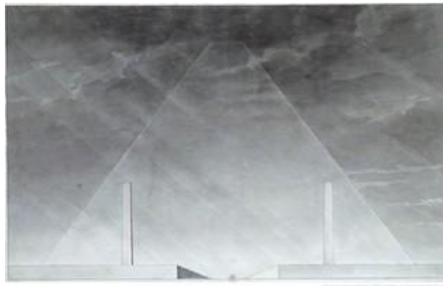
Étienne-Louis Boullée, Cénotaphe en forme de pyramide tronquée, dessin .

L'énergie de langage est en proportion inverse de la quantité de discours, on est en droit de supposer que le discours qui se réduirait à un mot, à un geste ou même au silence total, serait, de tous les modes le plus énergique 33 .