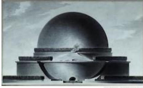
Étienne-Louis Boullée, dessin, cénotaphe de Newton n°14 (élévation géométrale).

Dans le projet dessiné du cénotaphe à Newton ci-dessus et l'agrandissement d'un détail (où l'on distingue les personnages près de la porte du monument réduits à une taille infime), on perçoit à quel point la démesure du projet excède le cadre d'une représentation réaliste.